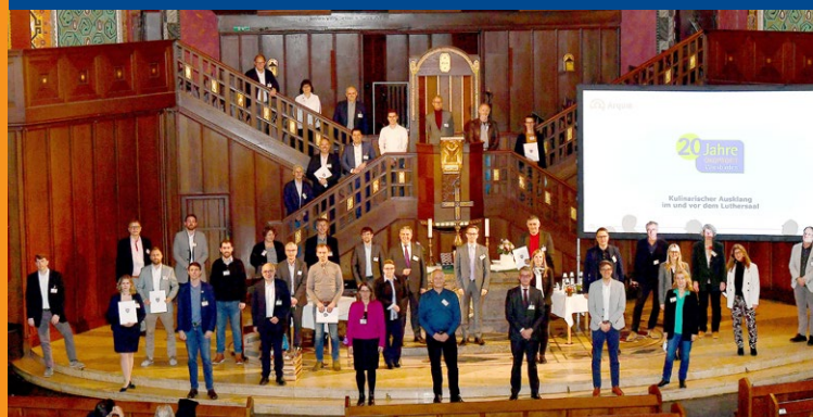
Die Wiesbadener ÖKOPROFIT-Betriebe 2020/2021 und der ÖKOPROFIT-Elektrobus

Umweltamt Wiesbaden Tel.: 0611 313741 umweltmanagement@wiesbaden.de www.wiesbaden.de/oekoprofit